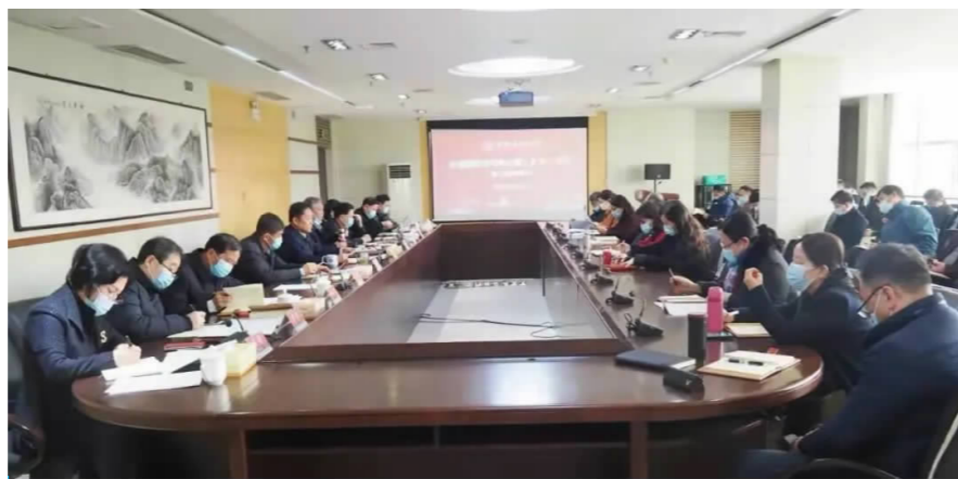
党委理论学习中心组(扩大)会议现场

会上,周春辉书记领学了习近平总书记在全国两会期间的重要讲话和全国两会精神,习近平总书记在中央政治局第三十七次集体学习时的讲话精神。周书记指出,这次全国两会是我国进入全面建设社会主义现代化国家、向第二个百年奋斗目标进军新征程的重要时刻召开的一次重要会议。习近平总书记在全国“两会”期间发表的系列重要讲话,提出了一系列新概念、新理论、新提法,具有很强的政治性、理论性、指导性和针对性,为在新征程上推动党和国家事业发展提供了重要遵循,为我们做好各项工作指明了前进方向。就贯彻落实好会议精神、做好当前