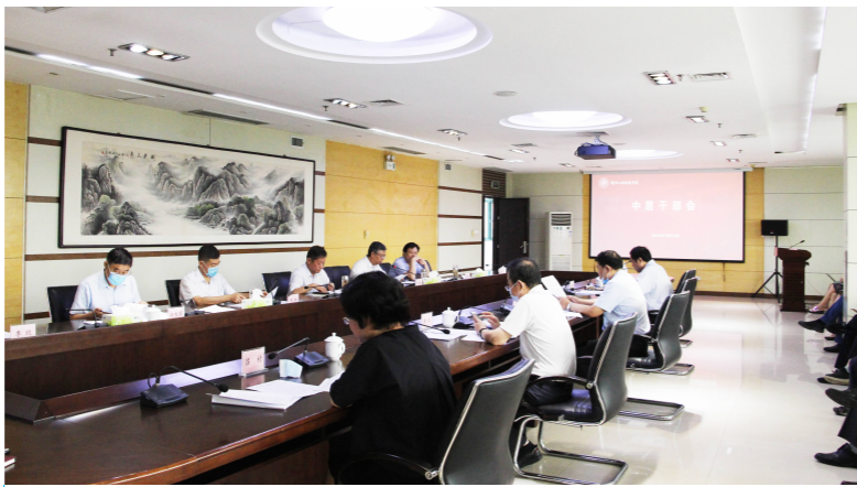
7月14日上午,我校在英才校区明德楼A座408会议室召开中层干部会议,安排部署暑假工作。

卢校长对暑期相关工作进行了安排部署,重点强调6个方面的工作。一是严格落实疫情常态化防控措施,各单位要加强师生健康管理,确保及时掌握师生健康信息;二是严格落实请假制度,干部职工确需离开郑州,要严格按照程序和管理权限履行审批手续;三是严格落实值班制度,遇突发事件值班人员要按程序及时处置上报;四是严格校园安全管理,除学校总值班室值班安排外,各单位也