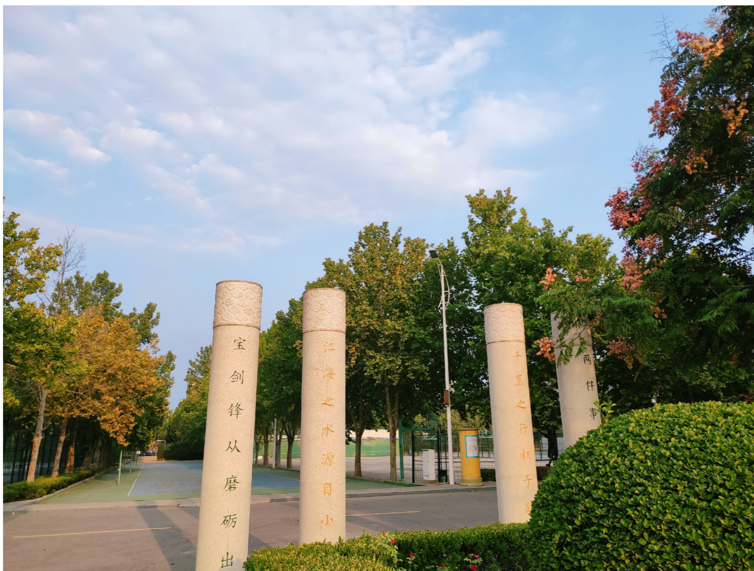
及时当勉励,岁月不待人