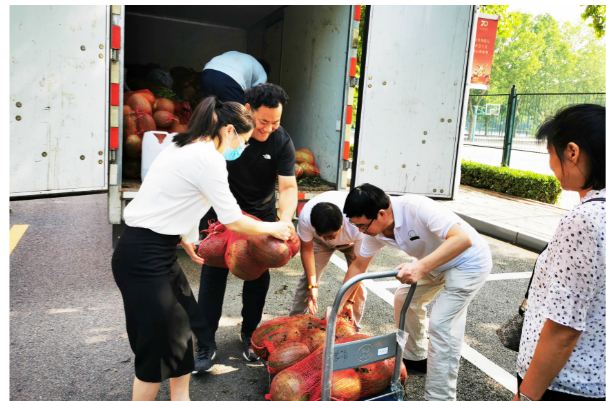
7月15日上午,我校驻村工作队陪同村民将学校工会集中购买的11500斤西瓜配送到学校。胡志学 摄

与此同时,学校各帮扶责任人得知情况后,在入村帮扶的同时开展现场采购,仅两天时间,现场采购的西瓜、哈密瓜价值达4400多元。此外,校区内还为贫困村设立临时农产品供销点。学校各级工会负责同志积极转发推荐产品信息,广大教工线上购买,线下配送。学校采取这种集中采购作为员工福利,教工爱心购买,校内设推等多渠道购买方式,购买贫困村的西瓜、哈密瓜和其它农产品,有效解决了瓜果集中上市滞销的问题。