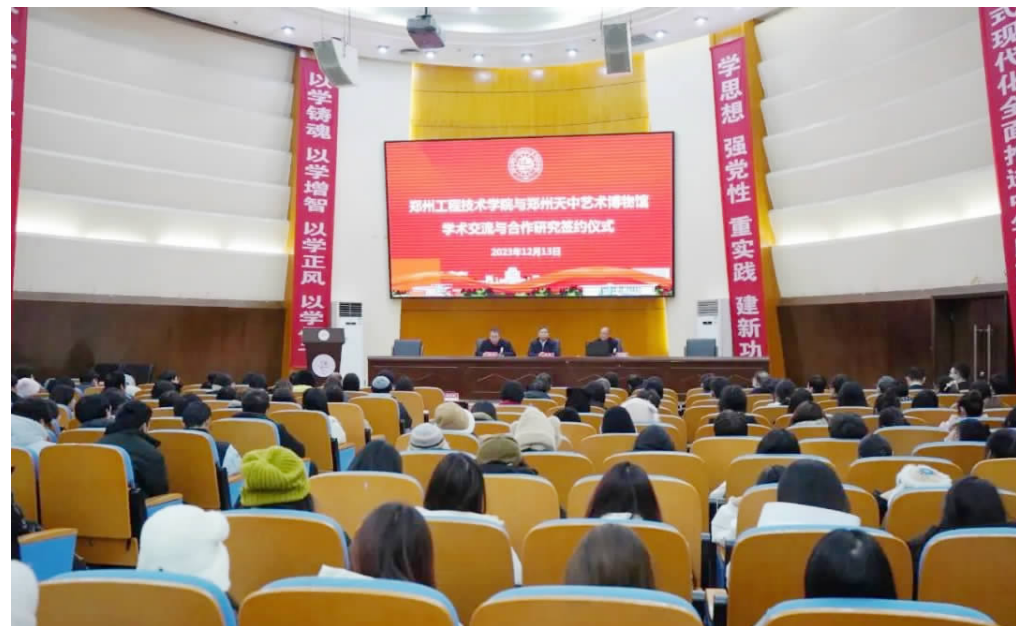
签约仪式现场

本报讯(通讯员 韩燕飞)12月13日下午,我校与郑州天中艺术博物馆学术交流与合作研究签约仪式在英才校区明德楼学术报告厅成功举行。党委书记甘勇,党委副书记、工会主席焦红波,党委委员常锋、吕村,科技处、校企合作处、学生处、团委、马克思主义学院主要负责人,文化遗产与艺术设计学院班子成员及师生代表300余人参加仪式。签约仪式由焦红波副书记主持。