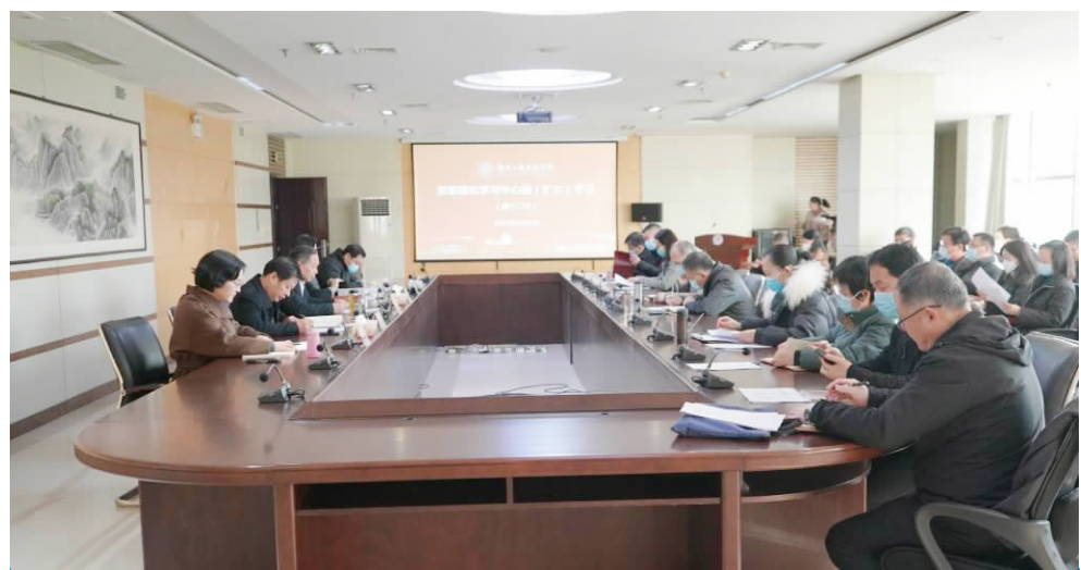
会议现场

本报讯(通讯员 韩燕飞)12月1日,党委书记甘勇在英才校区明德楼A408会议室主持召开党委理论学习中心组(扩大)学习会议,传达学习习近平总书记在二十届中央政治局第九次集体学习铸牢中华民族共同体意识时的讲话等重要内容。在校校领导,党委委员,各部门主要负责人和各学院党总支书记参加学习。