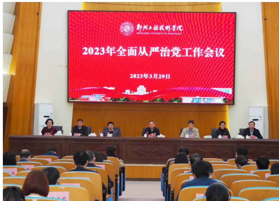
党委理论学习中心组(扩大)专题会议现场

本报讯(通讯员 韩燕飞)3月29日上午,我校在英才校区明德楼学术报告厅召开2023年全面从严治党工作会议,进一步分析研判当前全面从严治党的新形势、新任务、新要求,安排部署学校今年的全面从严治党工作,加快推进清廉郑工建设。校党委书记甘勇,党委副书记、工会主席苏炜,纪委书记谢霜云,副校长李欣,党委委员孙振营、常锋、吕村出席会议。会议由苏炜副书记主持。