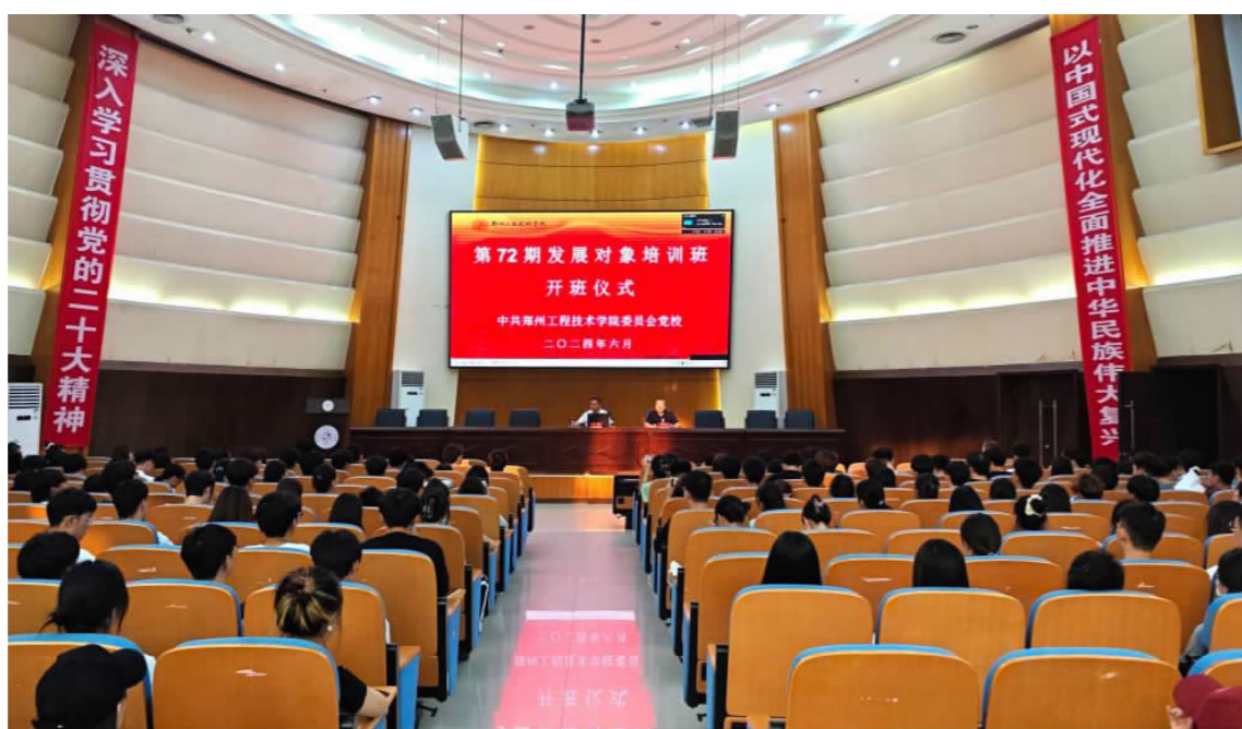
开班仪式现场

本报讯(通讯员 杜舒)为高质量做好发展党员工作,从源头上保证党员队伍的先进性、纯洁性,6月13日至6月25日,校党校举办第72期党员发展对象培训班,来自全校的260余名教工、学生发展对象参加了此次培训。