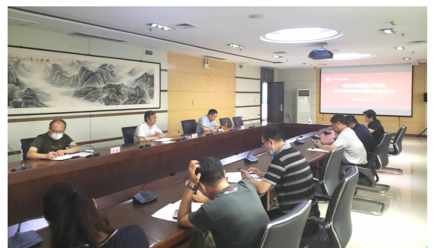
8月5日下午,我校在英才校区明德楼A408会议室召开2020年招生录取工作会议。

甘校长要求与会同志认真贯彻会议精神,认真落实卢校长提出的录取工作目标、工作纪律和后勤保障工作要求,确保全面完成招生任务;要确保各环节公平公正,做到工作的零差错、零失误;同时要切实做好突发事件的预防和处置,保证招生工作的健康平稳推进。