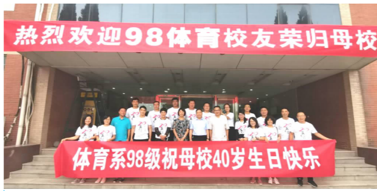
8月1日下午,体育学院98级校友毕业二十年重聚母校合影留念。

甘勇副校长听取了工作汇报。对文化遗产学院探究教学工作的积极态度给予认可,肯定了学院的工作成绩。对学院2020年度春季学期教学中存在的问题和接下来的教学工作如何开展提出了三点意见:一是学院要明确专业发展定位,坚持学院特色,彰显学院的价值和存在意义;二是要聚焦师资建设问题,这是学院发展道路上的重点;三是梳理总结学院自建院以来的工作成果并将其向理论化、规范化转化,制定出一套具有参考、学习价值的工作标准,提升学院工作质量。