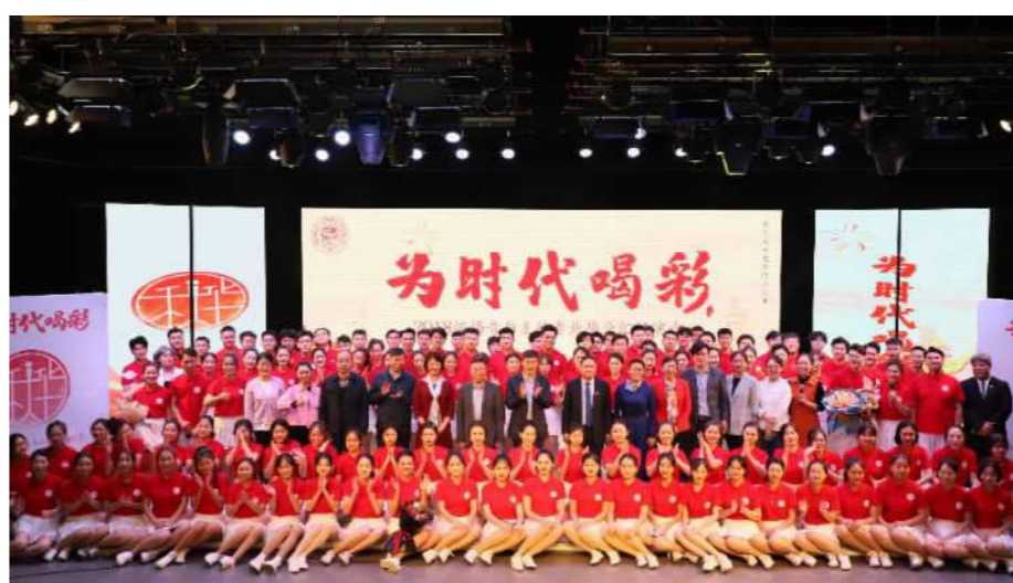
我校传媒学院2018级播音与主持专业毕业生与出席观看汇报演出的领导、嘉宾合影留念。

开场舞《Beginning》展现了大学生的青春与活力,相声《嘻哈带货》将直播与说唱元素融入其中,展现了同学们的创新意识和对社会热点的关注;贯口《春天里的小红帽》以诙谐的语言风格、生动的舞台表演再现了疫情期间大学生宅在家的生活学习状态,向观众传递快乐的同时也让我们对疫情进行了审视与思考;情景朗诵《青春,平凡中闪亮》讲述了疫情期间那些点亮城市微光的平凡人做的种种不平凡的事迹;小品《我们一起同过窗》记录了同学们在校挥洒的青春岁