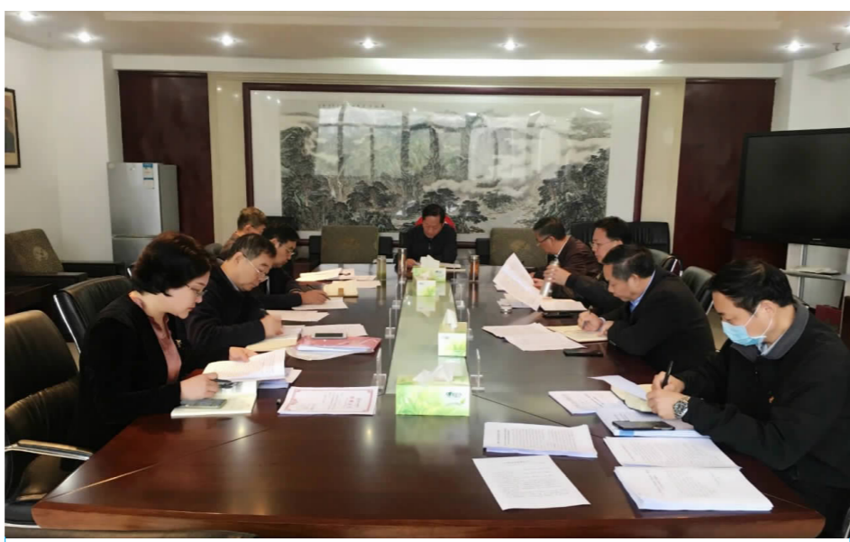
学校第二十一次党委会会议现场