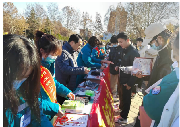
活动现场图

通过本次教改项目结项答辩会上各项目所凝练的教学成果展示与交流,充分发挥了优秀教学成果的示范引领作用。必将进一步推动学校在人才培养模式、课程体系、教学内容、教学方法和手段、实践教学、课程思政建设、教学质量评价等方面取得实质性的改进和提高。