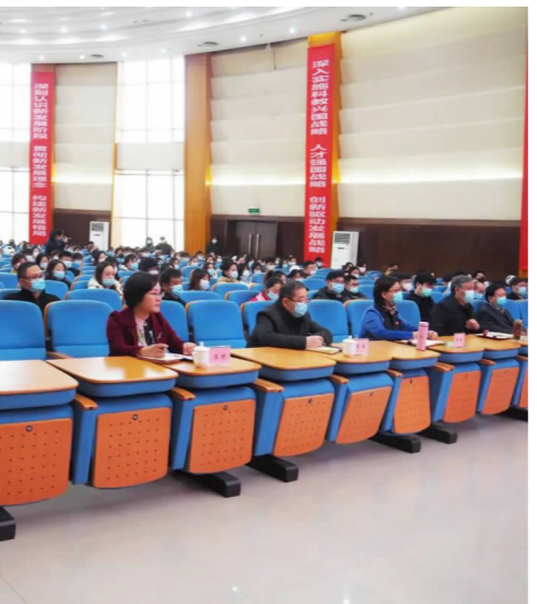
宣讲现场图

周书记结合个人学习体会,就全面学习贯彻党的十九届六中全会精神,从学校、教师、学生三个层面提出了要求。一是加快学校发展,努力成为河南郑州经济发展服务。要加快自身发展,召开全校发展活力显著增强动员会,明确下一步学校发展方向。要围绕河南郑州产业发展方向,布局学科专业、科研、人才培养计划,加强谋划,形成合力。二是把做“四有”教师当成目标,努力提高教书育人水平。要按照“四有”“六要”