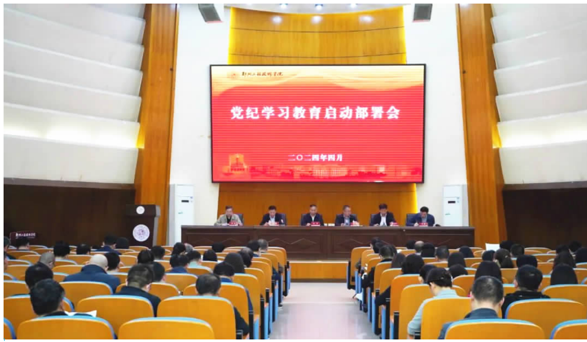
党纪学习教育启动部署会现场

甘勇书记作动员讲话。他表示,要深刻领会开展党纪学习教育的重要意义,准确把握开展党纪学习教育的目标要求、任务安排,教育引导全校师生党员学纪、知纪、明纪、守纪,真正使这次党纪学习教育成为全体党员深刻领悟“两个确立”的决定性意义、坚决做到“两个维护”、切实把思想和行动统一到党中央决策部署上来的生动实践,成为党员领导干部增强纪律意识、提高党性修养的生动实践。为确保党纪学习教育取得实效,为开启高水平有特色应用型本科高质量发展的新篇章提供坚强政治保证,甘书记强调,一是要提高政治站位,充分认识党纪学习教育的重要意义,以习近平总书记重要讲话重要批示为根本遵循,为全校党纪学习教育工作稳航定向,确保学习教育工作不变形、不走样;二是要迅速行动,把党纪学习教育